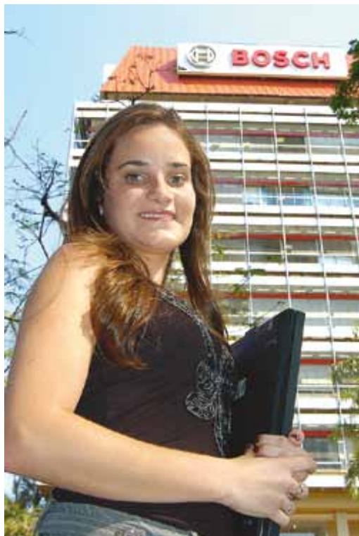
Estágio e trainee: rumo à evolução