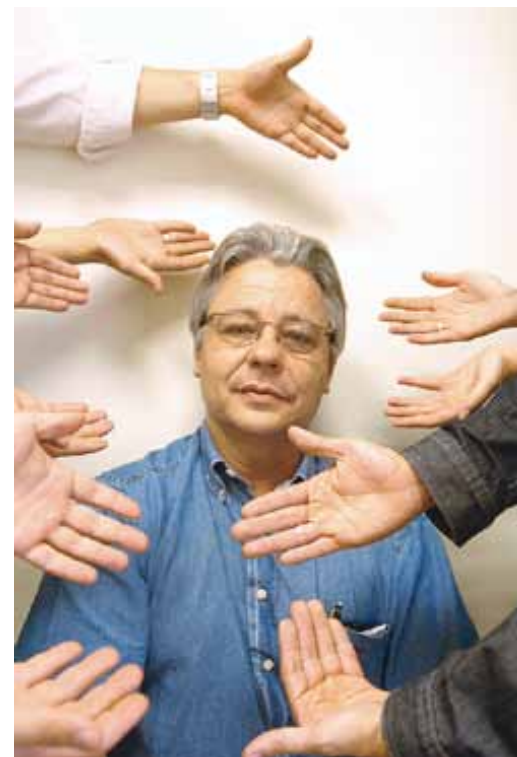
Apoio para crescer