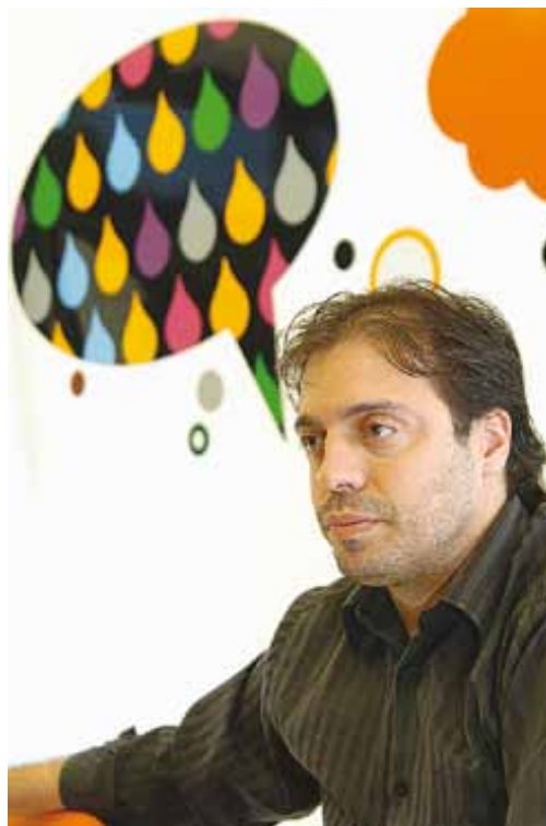
A força da criatividade